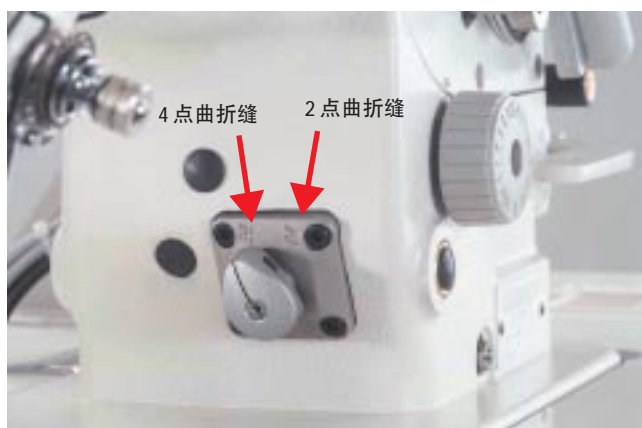
2 点曲折缝·4 点曲折缝的切换扳手